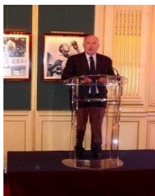
M. Dominique Bussereau