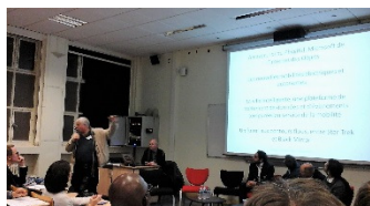
13 02 Smart Mobility