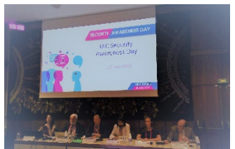
18 21 juin UIC Security Week