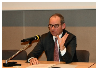
07 02 Vœux à l'UIC

Maintenant traditionnel chaque été, Flash AFFI Infos vient compléter l' AFFI Infos n°25 que vous avez reçu en février. Il fait le point sur nos activités du premier semestre et vous rappelle celles qui sont prévues de septembre à décembre. Plusieurs conférences et visites vous ont été proposées lors de ce premier semestre en privilégiant, comme toujours, les échanges et la convivialité.