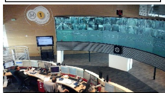
05 03 PCC Ligne 1

- Le 13 février : dans le cadre de nos relations partenariales avec Télécom-ParisTech, les membres de l'AFFI ont été invités à participer aux « entretiens du numérique ». Véhicules autonomes, robots-taxis, navettes autonomes... une nouvelle mobilité est arrivée, boostée par la montée en puissance du numérique avec l'intelligence artificielle, le big data et l'internet des objets. Comment nos concitoyens, les opérateurs publics de transport et les collectivités territoriales préparent-ils cette mutation technologique qu'est la « Smart City » ?