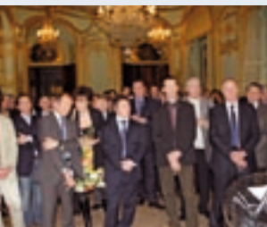
Un large auditoire pour la soirée des vœux