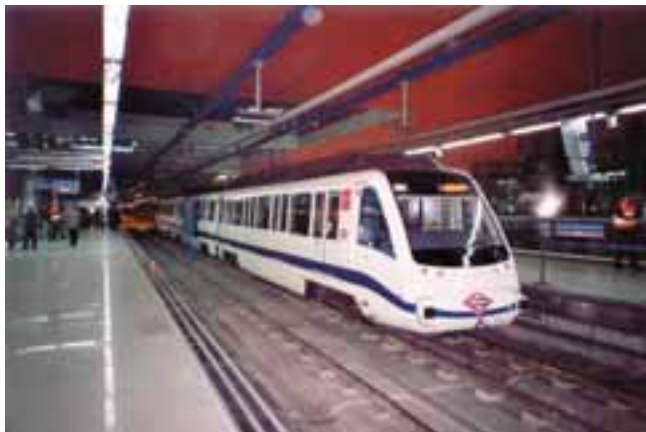
Le Métro de Madrid ...

la lutte contre les incendies en station et, surtout, dans les trains. La visite du Métro de Madrid a permis de prendre connaissance de l'approche sécuritaire de ce réseau méconnu au Nord des Pyrénées.