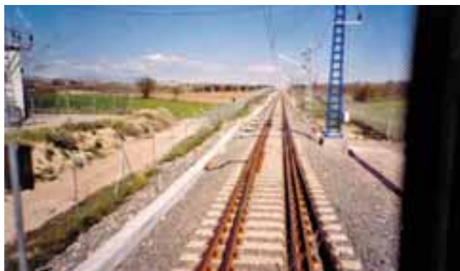
Imbrication de la voie normale dans la voie large sur la section Tardienta-Huesca

sur environ 50 km puis de Tardienta à Huesca, un troisième rail a été posé sur la voie unique à écartement ibérique sur 21 km. Le tout a été doté d'une caténaire à 25 kV et certaines sections sont parcourables à la vitesse de 200 km/h. Ainsi, les trains Altaria, composés de matériels Talgo relie Madrid à Huesca, sans rupture de charge, en environ 2 heures 40. Pour les dessertes au-delà de Huesca, une station de changement d'écartement en marche (à 15 km/h) est installée en avant-gare permettant aux autorails régionaux à écartement variable de poursuivre leur route sur la voie large jusqu'à Jaca, voire Canfranc. La liaison Saragosse - Huesca prend dorénavant une quarantaine de minutes contre pratiquement une heure autrefois.