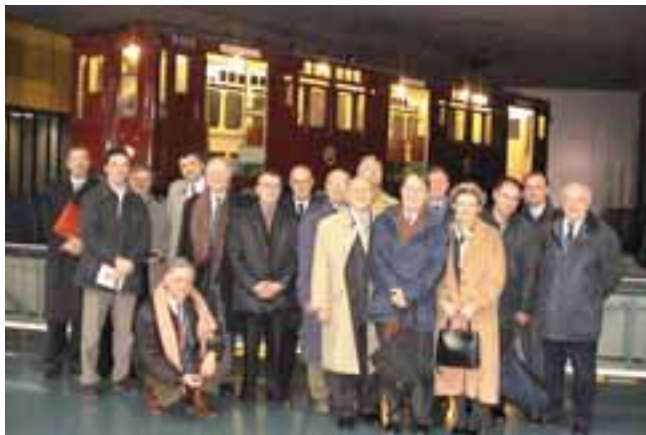
...et le groupe AFFI

Suivant la piste ouverte dès la moitié des années 90 par les recherches conduites dans les milieux maritimes et aéronautiques, le " Metro de Madrid " a recherché à développer des moyens d'interventions utilisant de l'eau pulvérisée sous forte pression supérieure à 33 bar avec des buses de diffusion de 50 µ. L'eau pulvérisée en fines particules par des buses de diamètre micrométrique arrivant à grande vitesse développe un grand pouvoir d'absorption de la chaleur et des gaz à haute température. Cela peut suffire à empêcher le processus de combustion. Une absorption de 30 à 60% de la chaleur peut suffire à stopper un feu par l'effet combiné de la réduction d'oxygène et de la réduction brutale de température.