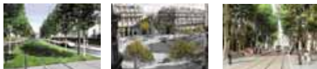
avenue William Booth