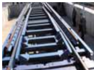
Installation de changement d'écartement

A Huesca, notre groupe a pu assister, tant à bord qu'au sol, à plusieurs manœuvres de changement d'écartement et a pu observer de près les installations conçues et développées par CAF (Constructeur de matériels roulant) et Talgo dont la simplicité apparente ne peut que surprendre. Face à cette réalisation, force est de constater que la RENFE et GIF, loin de considérer la dualité d'écartements en Espagne comme un handicap, ont développé avec l'industrie privée des solutions extrêmement ingénieuses pour amplifier " l'effet réseau " à partir des lignes à grandes vitesses. Ainsi, la preuve est faite que la correspondance avec un autocar, serait-il de grand confort, dans la cour d'une gare d'une ligne à grande vitesse, peut être intelligemment remplacée par une liaison sans rupture de charge. Elle est également faite pour que la différence d'écartement ne soit pas un obstacle insurmontable. Ces visites extrêmement instructives, nous ont permis de découvrir, voire de redécouvrir, un chemin de fer en pleine évolution.