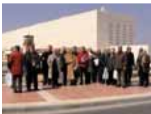
Le groupe devant la nouvelle gare de Saragosse

Sous la direction de l'architecte de la nouvelle gare et de son équipe, nous avons découvert le vaste bâtiment dont l'aspect peut étonner par sa sobriété et ses dimensions impressionnantes. Ce vaste parallélépipède de 500 m de long, 110 m de large et d'une vingtaine de mètres de haut abrite au niveau du sol 5 voies à l'écartement standard UIC et 5 voies à écartement ibérique de 1673 mm. Ces 10 voies sont desservies par 6 quais de 400 m de long. La gare est dimensionnée pour un trafic annuel de 4 millions de voyageurs qui peuvent trouver sur place outre les services et magasins habituels, des hôtels, un centre de Congrès et un " Fitness Center ". Cet immense bâtiment a été conçu pour supporter les fortes températures estivales, avec un nombre d'ouvertures réduit et des baies dotées de vitrages athermiques.